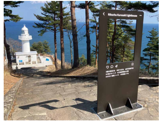
表示板サイズ：W600xH1200 表示方法：カッティングシート 本体素材：ステンレス